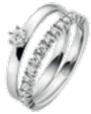
< RINGE Solitaire & Memoire bei Uhrwerk ab € 369,00