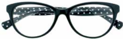
RALPH RALPH LAUREN