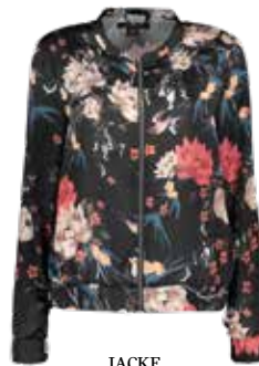
JACKE mit Flower-Print bei New Yorker um € 19,95