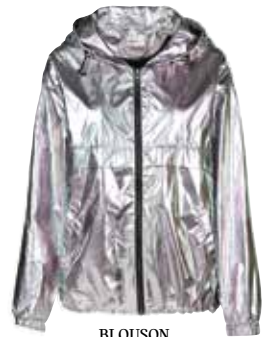
BLOUSON in Silber von Only bei Kastner & Öhler ab € 49,99