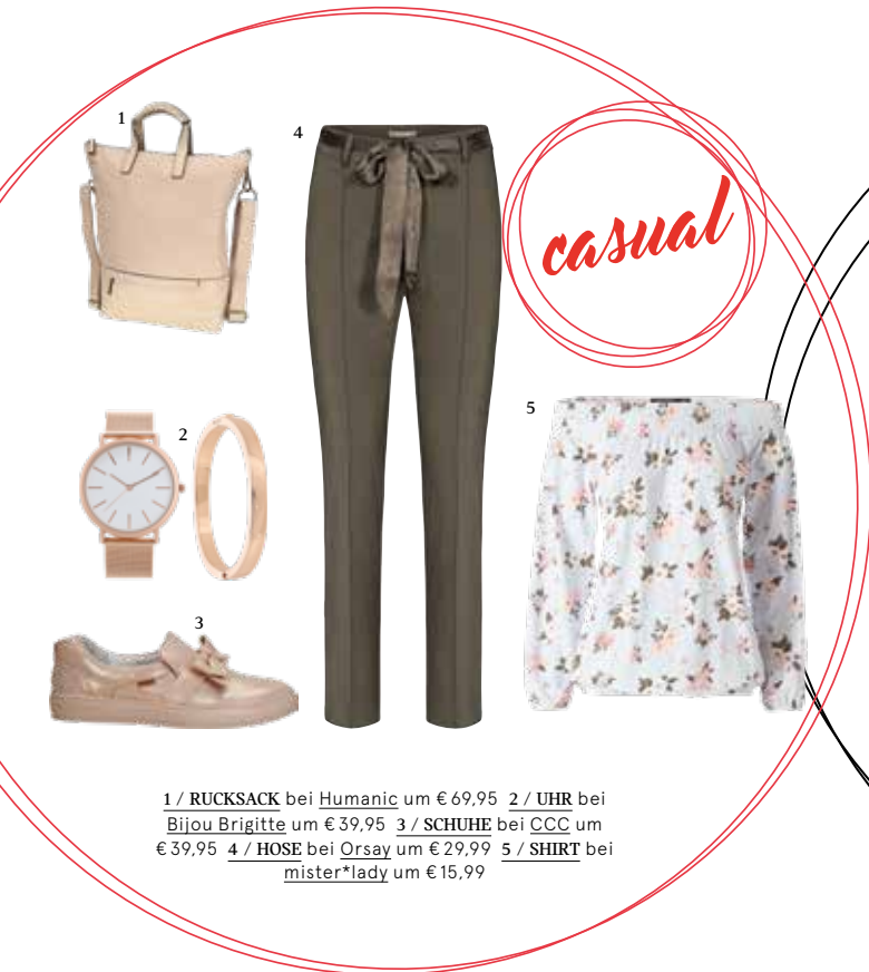
1 / RUCKSACK bei Humanic um € 69,95 2 / UHR bei Bijou Brigitte um € 39,95 3 / SCHUHE bei CCC um € 39,95 4 / HOSE bei Orsay um € 29,99 5 / SHIRT bei mister*lady um € 15,99