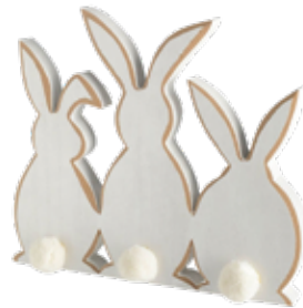
< DEKOFIGUR Hasen-Motiv bei Depot um € 7,99