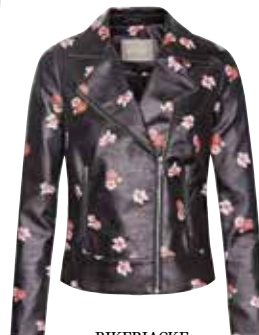
BIKERJACKE mit Flower-Print bei Orsay um € 49,99