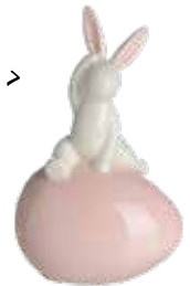
> DEKOFIGUR Hase auf Ei bei Depot um € 4,99