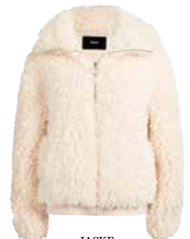
JACKE in Lammplüsch bei BIKBOX um € 59,99