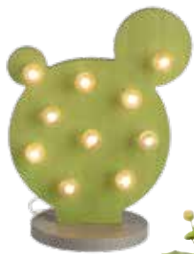
< KAKTUS Leuchtojekt bei Depot um € 12,99