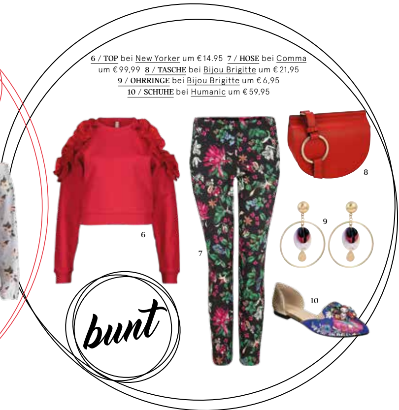
6 / TOP bei New Yorker um € 14,95 7 / HOSE bei Comma um € 99,99 8 / TASCHE bei Bijou Brigitte um € 21,95 9 / OHRRINGE bei Bijou Brigitte um € 6,95 10 / SCHUHE bei Humanic um € 59,95