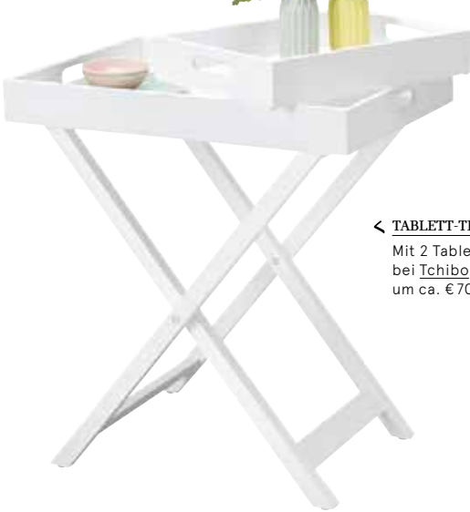
< TABLETT-TISCH Mit 2 Tablett bei Tchibo um ca. € 70