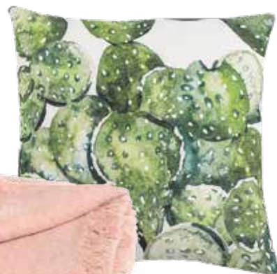
< ZIERKISSEN Motiv Kaktus bei Depot um € 12,99