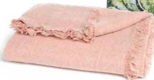
PLAID Soft Koralle bei Depot um € 24,99 ✓