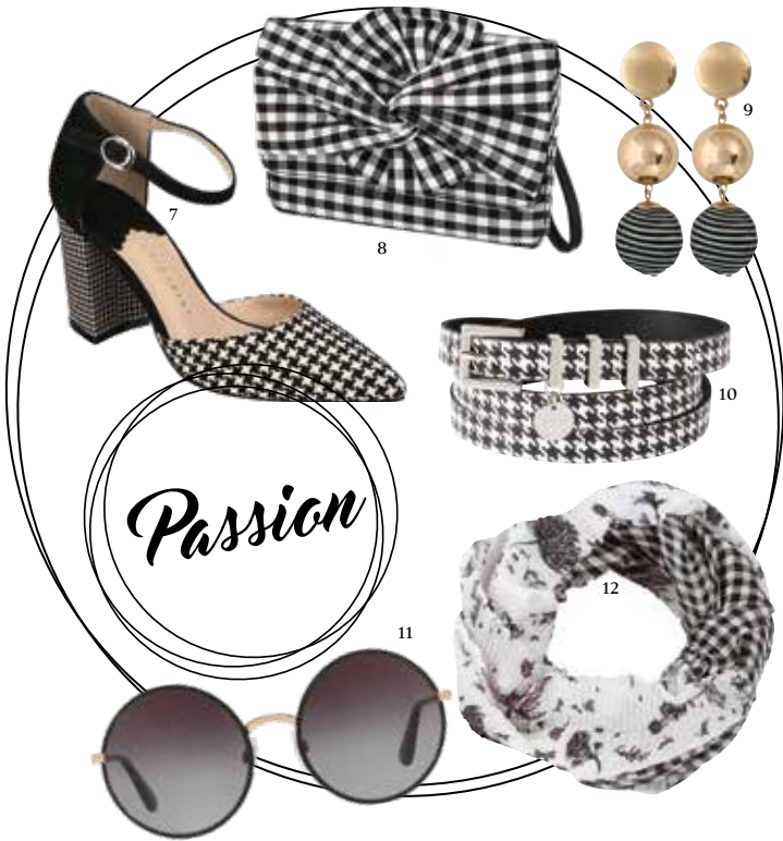
1 / SCHAL bei Comma um €19,99 2 / SONNENBRILLE bei sehen!wutscher um €141 3 / SCHUHE bei New Yorker um €24,95 4 / TASCHE bei Comma um €29,99 5 / ARMREIFEN bei UHR-Werk Liezen um €19 6 / GÜRTEL bei Comma um €39,99 7 / PUMPS bei Humanic um €69,95 8 / TEXTIL-CLUTCH bei Humanic um €34,95 9 / OHRRINGE bei Bijou Brigitte um €7,95 10 / GÜRTEL bei Comma um €29,99 11 / SONNENBRILLE bei sehen!wutscher um €190 12 / SCHAL bei Comma um €29,99