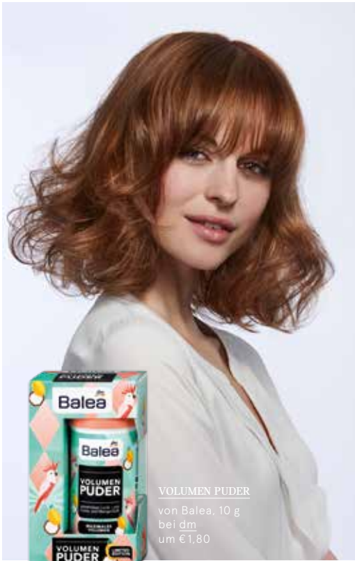
VOLUMEN PUDER von Balea, 10 g bei dm um € 1,80