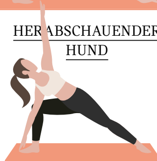
GESTRECKTER SEITLICHER WINKEL

Diese Asana kräftigt u. a. Knie und Oberschenkel, strafft Arme, Bauch und Po und soll sogar die Verdauung in Schwung bringen.