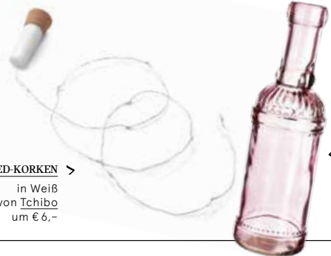
LED-KORKEN > in Weiß von Tchibo um € 6,-

E ine Flasche voller Licht – ohne Kabelsalat oder Wachstropfen. Dazu brauchst Du nur zwei Dinge: eine hübsche Flasche in einem Farbton Deiner Wahl, z. B. von Depot (Tipp: je heller, desto besser!) und den cleveren LED-Korken, den du bei Tchibo findest. Lichterkette in die Flasche füllen, zukorken, einschalten, genießen!