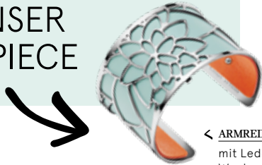
← ARMREIF mit Ledereinlage zum Wechseln/Wenden bei UHR-Werk Liezen um €113,-

Tip Kombiniere schlichte Outfits mit extravagan-ten Accessoires!