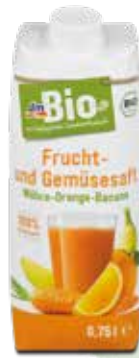
^ SAFT von dm um €1,95