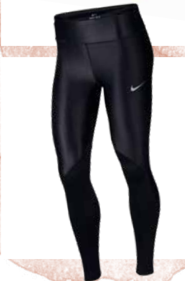
< HOSE in Schwarz bei Gigasport um € 50,-