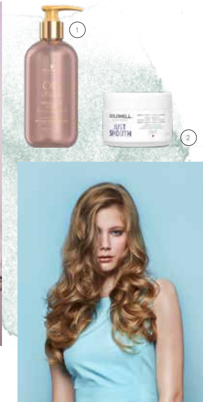
1 / OIL ULTIME MARULA & ROSE LIGHT OIL-IN-SHAMPOO bei Frisör Klipp um € 17,30 2 / DUALSENSES JUST SMOOTH 60SEK PFLEGE-KUR bei Frisör Klipp um € 15,70