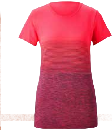
< SHIRT in Rot bei Tchibo um € 15,-