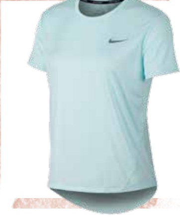
< SHIRT in Blau bei Gigasport um € 30,-