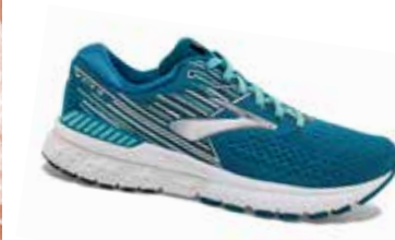
< SCHUHE in Blau bei Gigasport um € 140,-