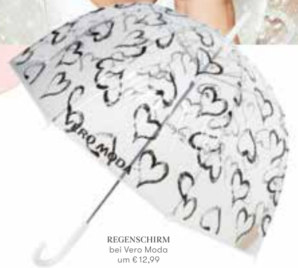
REGENSCHIRM bei Vero Moda um € 12,99