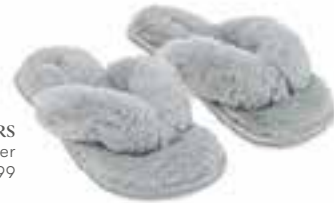
SLIPPERS bei Hunkemöller um € 17,99