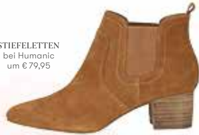
STIEFELETTEN bei Humanic um € 79,95