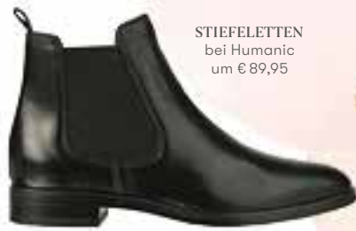
STIEFELETTEN bei Humanic um € 89,95