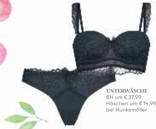
UNTERWÄSCHE BH um € 37,99 Höschen um € 14,99 bei Hunkemöller

Sexy und gemütlich schließen sich nicht aus, sondern ergänzen sich auf höchst attraktive Art!