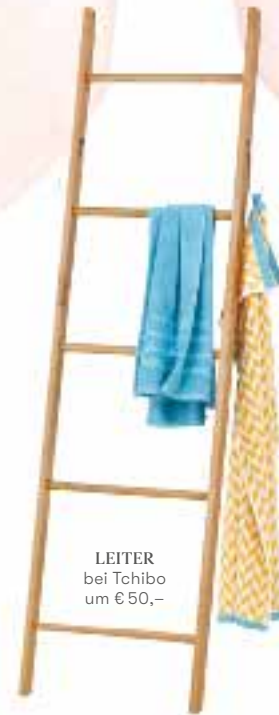
LEITER bei Tchibo um € 50,-