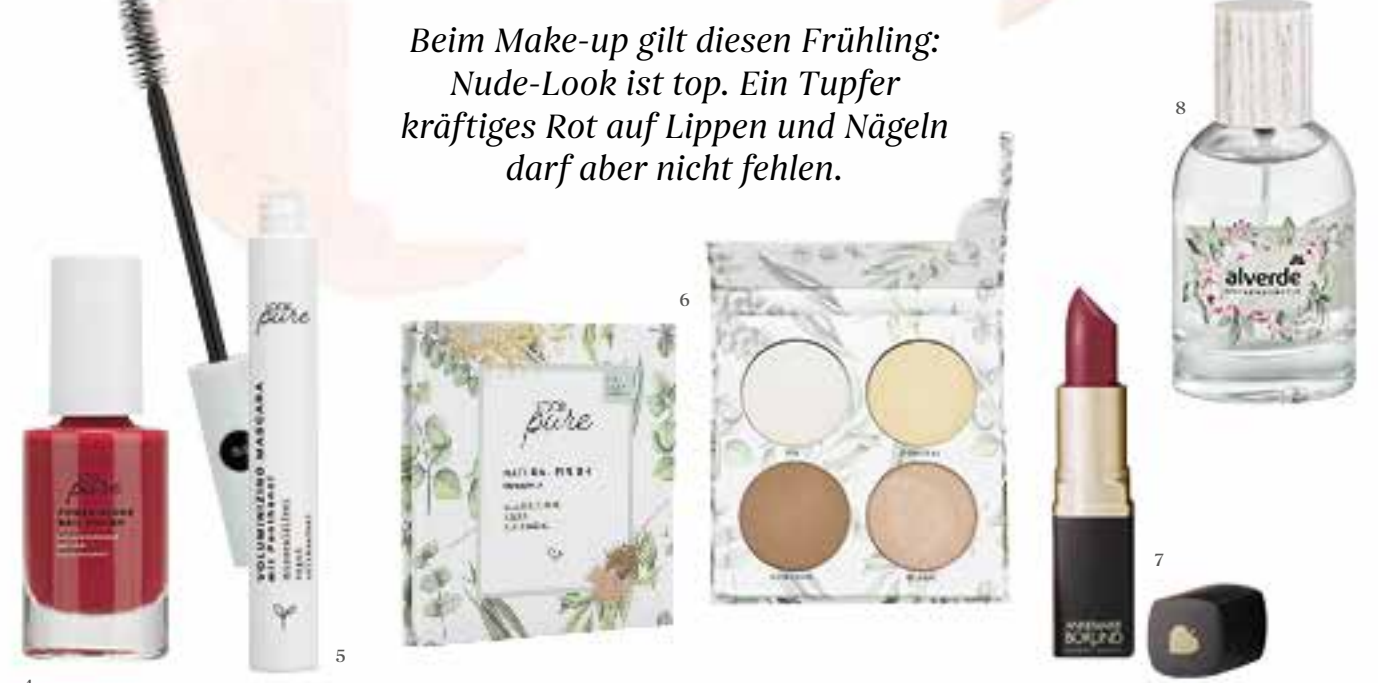
4 5 6 7 8 1. SHAMPOO bei Douglas um € 9,99 2. CONDITIONER bei Klipp um € 22,50 3. FESTES SHAMPOO bei dm um € 3,45 4. NAGELLACK LOOK BY BIPA PURE bei BIPA um € 3,45 5. MASCARA LOOK BY BIPA PURE bei BIPA um € 3,95 6. FACE PALETTE LOOK BY BIPA PURE bei BIPA um € 7,95 7. LIPPENSTIFT bei Reformstark Martin um € 13,99 8. NATURDUFT bei dm um € 9,95

Beim Make-up gilt diesen Frühling: Nude-Look ist top. Ein Tupfer kräftiges Rot auf Lippen und Nägeln darf aber nicht fehlen.