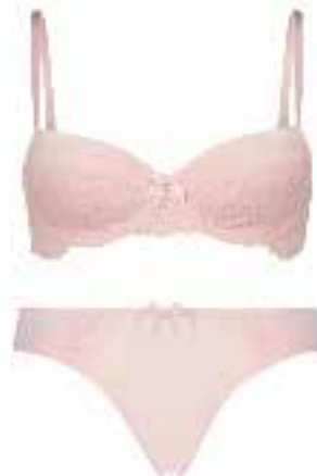
UNTERWÄSCHE BH um € 32,99 Höschen um € 14,99 bei Hunkemöller