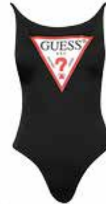
BADEANZUG bei Kastner & Öhler um € 59,90