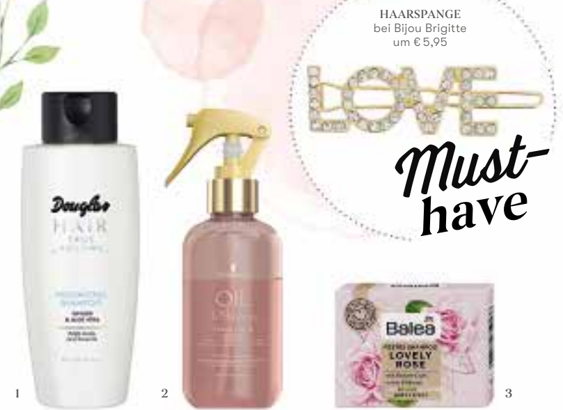
HAARSPANGE bei Bijou Brigitte um € 5,95