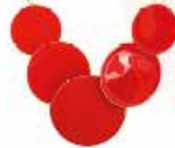
KETTE bei Bijou Brigitte um € 14,95

BLICKFANG Peppt dezente Outfits spielend auf.