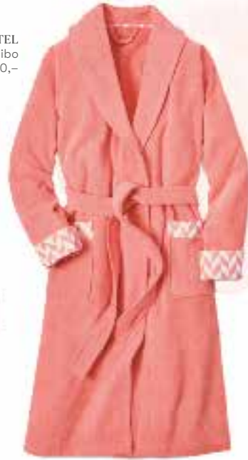
BADEMANTEL bei Tchibo um € 40,-