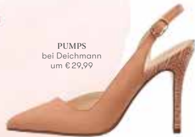
PUMPS bei Deichmann um € 29,99