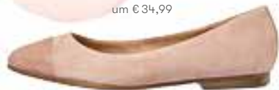
BALLERINAS bei Deichmann um € 34,99

BLICKFANG Peppt dezente Outfits spielend auf.