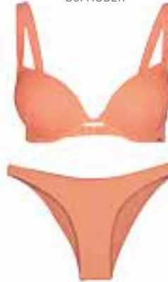
BIKINI Oberteil um € 12,99 Unterteil um € 8,99 bei New Yorker