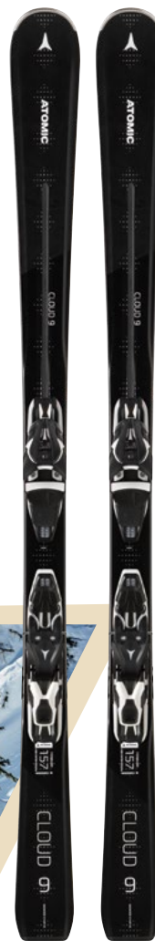
SKI & BINDUNG von Atomic bei Gigasport um € 479,99

Auf in eine tolle Wintersport-Saison – gemeinsam mit den erfahrenen Wintersport-Experten von Gigasport. Bei Gigasport im ELI findest Du sämtliche Highlights des Winters unter einem Dach: die neueste Skimode, die aktuellsten Snowboards, vom Kinder-Ski bis zum Touren-Ski, vom Allmountain-Freeride-Ski und Race-Carver bis zum Lady-Ski und den High-End-Modellen der namhaftesten Marken. Natürlich bietet Dir Gigasport im ELI auch optimale Beratung zu allen Wintersport-Themen, damit Du hundertprozentig die für Deine Anforderungen passende Ausrüstung findest. Besonders wichtig: der perfekt passende Schuh. Die Gigasport-Experten sind hierfür bestens geschult und bieten Dir Bootfitting mit dem absoluten „Wow“-Effekt: in nur drei Schritten zum wie maßgeschneidert sitzenden Schuh, der nicht nur besonders bequem und druckfrei sitzt, sondern Dich auch zum besseren Skifahrer macht!