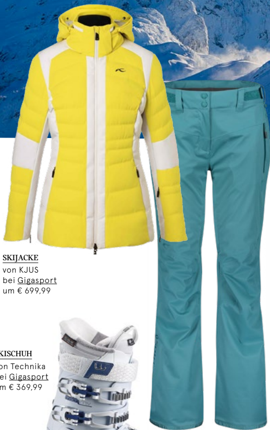
SKIJACKE von KJUS bei Gigasport um € 699,99