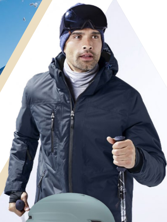
JACKE von Tchibo bei Tchibo um ca. € 80,-