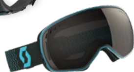
SKIBRILLE von SCOTT bei Gigasport um € 199,95