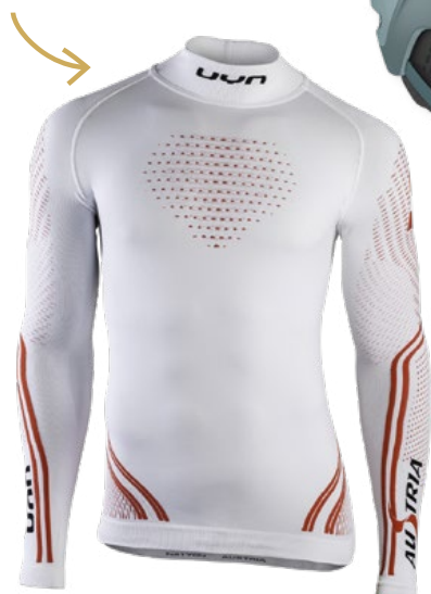
FUNKTIONSSHIRT von UYN® bei Gigasport um € 119,99

DAS BESTE FÜR DARUNTER Neu, anders und stylish: UYN®, die neue Marke für Funktionsunterwäsche aus Italien, sorgt für optimales Körperklima beim Sport.