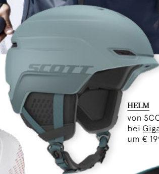
HELM von SCOTT bei Gigasport um € 199,95