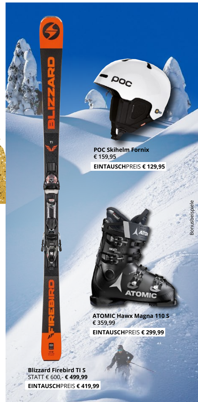
POC Skihelm Fornix € 159,95