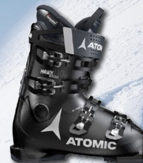
ATOMIC Hawx Magna 110 S € 359,99