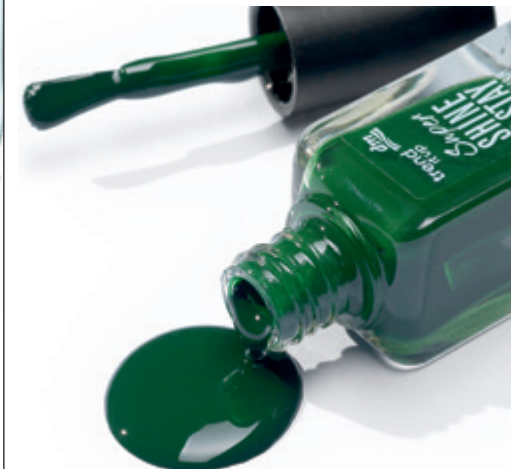
NAGELLACK in der Farbe Dark Green, um € 2,25 erhältlich bei dm

5 Eine vegane Formel, die deine Nägel stärkt, Hochglanz-Finish und große Farbauswahl: Das sind die Super Shine & Stay-Lacke.