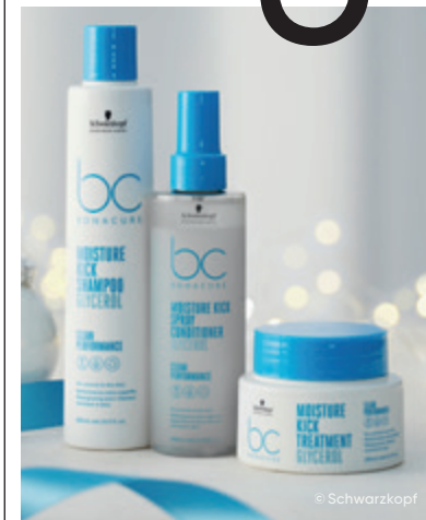
HAARPFLEGE-SET von Schwarzkopf , um € 48,50 erhältlich bei ROMA Friseurbedarf