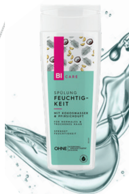
HAARSPÜLUNG mit Kokoswasser und Pfirsichduft, um € 1,49 erhältlich bei BIPA