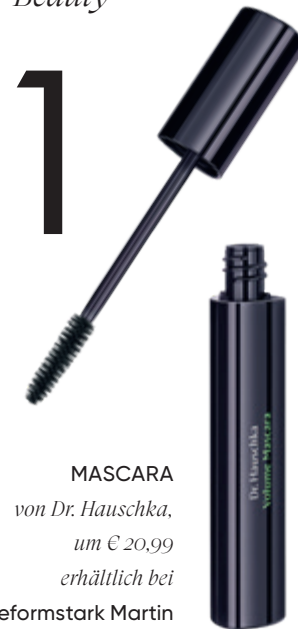
MASCARA von Dr. Hauschka , um € 20,99 erhältlich bei reformstark Martin